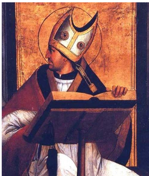
Juan de Borgogna, Sant'Agostino tempera su tavola inv. Q 1811