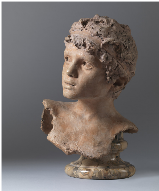
Vincenzo Gemito, Le Harponneur [Il Fiociniere] , 1872 Terre cuite, 34 x 26 x 24 cm Naples, Collection Intesa Sanpaolo.

Gemito reprendra vingt ans après Carpeaux le même sujet, un jeune pêcheur, mais en cherchant l'observation crue et nette de la réalité quotidienne. Il effectue ainsi une véritable rupture en exposant à Paris, en 1877, la figure « repoussante » de son Pêcheur napolitain, véritable manifeste du vérisme napolitain. C'est à la redécouverte de cet artiste, resté célèbre à Naples mais oublié en France, qu'invite l'exposition co-organisée avec le Musée national de Capodimonte.