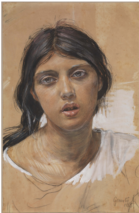
Vincenzo Gemito, Gitane [Zingara] , 1885 Fusain, sanguine, aquarelle, gouache sur papier 46,5 x 30 cm Naples, Collection Intesa Sanpaolo

Mais, à partir de 1885, l'état mental de Gemito commence à s'altérer. Perturbé par le projet de commande par le roi Umberto I er d'une statue monumentale de Charles Quint, l'artiste se rend immédiatement à Paris pour demander conseil à son ami Meissonier et réalise une esquisse en cire, dont a été tiré le bronze présenté ici. En 1886, une autre commande du roi Umberto I er pour un immense surtout de table en argent ébranle davantage encore l'état psychique du sculpteur, qui est hospitalisé à la clinique Fleurent de Naples. À sa sortie, il s'enferme dans une sorte d'exil volontaire. Il revient alors à ses sujets de prédilection, les jeunes pêcheurs et les adolescents nus, mais dont les formes et les lignes se manièrent, pour insister davantage sur les détails, comme dans un travail d'orfèvre.