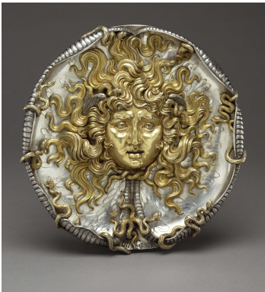
Vincenzo Gemito, Médaille à la tête de Méduse [ Medaglione con testa di Medusa ] 1911, argent doré, diamètre 23,5 cm Getty Museum, Los Angeles

par les artistes, en particulier Giorgio de Chirico et son frère, Alberto Savinio. Figurent également ici deux sculptures : une Gitane , en écho au célèbre dessin de la Zingara , et la statuette d'une femme nue, qui renvoie à la même modernité que celle des dessins, avec une radicalité anticipant les nus d'un Charles Despiau ou d'un Aristide Maillol.