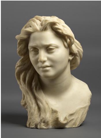
Vincenzo Gemito, Buste d'Anna [Busto di Anna] Vers 1886, marbre, 40 x 28 x 28 cm Naples, Museo e Real Bosco di Capodimonte