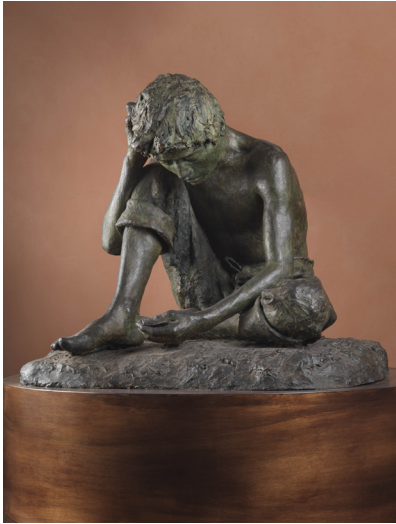
Vincenzo Gemito, Joueur de cartes [Il giocatore] vers 1869, plâtre patiné, 80 x 80 x 64 cm, Naples, Museo e Real Bosco di Capodimonte.