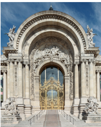
Petit Palais, musée des Beaux-Arts de la Ville de Paris

Construit pour l' Exposition universelle de 1900 , le bâtiment du Petit Palais, chef d'œuvre de l'architecte Charles Girault, est devenu en 1902 le Musée des Beaux-Arts de la Ville de Paris. Il présente une très belle collection de peintures, sculptures, mobiliers et objets d'art datant de l'Antiquité jusqu'en 1914 .