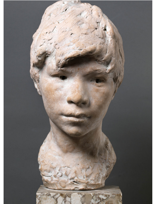
Vincenzo Gemito, Tête de petit garçon, 1870-1872. Museo e Certosa di San Martino, Naples.

Le Petit Palais est très heureux de présenter, en ouverture de sa saison napolitaine, l'œuvre inédite en France du sculpteur Vincenzo Gemito (1852-1929). L'histoire de Gemito est celle d'un enfant trouvé, élevé dans les rues de Naples qui va devenir l'un des plus grands sculpteurs de son temps, célébré dans sa ville natale puis dans le reste de l'Italie et en Europe. À vingt-cinq ans, il fait sensation au Salon à Paris puis l'année suivante à l'Exposition Universelle de 1878. Tour à tour décrié et adulé par la critique, il introduit le réalisme dans la sculpture italienne. Revenu à Naples, il continue son œuvre malgré des crises de folie. Après sa mort, il disparaît peu à peu de l'Histoire, relégué au rang d'un artiste du pittoresque, oubliant son rôle primordial sur la sculpture de son temps. Avec près de 120 œuvres, c'est donc une véritable redécouverte que propose le Petit Palais avec la collaboration exceptionnelle du musée de Capodimonte à Naples où l'exposition sera ensuite présentée.