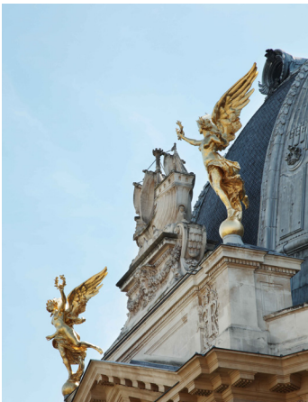
Petit Palais, musée des Beaux-Arts de la Ville de Paris