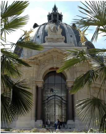
Petit Palais, musée des Beaux-Arts de la Ville de Paris