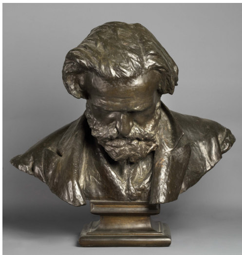
Vincenzo Gemito, Buste de Giuseppe Verdi [ Busto di Giuseppe Verdi ], 1873, Bronze, 42 x 63 cm

En 1874, Gemito exécute le buste en terre cuite de Guido, le jeune fils du préfet Diomede Marvasi, dont la tête baissée aux cheveux